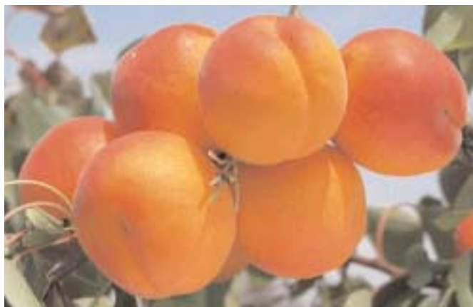
▲ Fig. 2 - Kyoto, nuova cultivar di media epoca di maturazione, meritevole di sperimentazione, in quanto dotata di bel sopraccoloro, buona consistenza, produttività e buona tenuta in pianta.

vecchia cv di origine vesuviana, rimane un riferimento nel periodo medio-precoce, che trova un vantaggioso utilizzo non solo al Sud, ma anche al Centro. Orange Red® , dopo aver suscitato molte speranze al Nord, viene ovunque già sostituita per problemi di costanza produttiva, dovuti sia all'autoincompatibilità sia all'habitus produttivo. Si hanno, specialmente dalle Unità operative del Nord le prime informazioni su Robada* : il frutto è molto attraente, con colorazione intensa, buona consistenza e lenta evoluzione della maturazione. La produttività è risultata soddisfacente. In Piemonte, in contrasto con informazioni bibliografiche riferite ad altri areali, è risultata autoincompatibile. Da verificare la resistenza alle manipolazioni, la pezzatura ed il sapore.