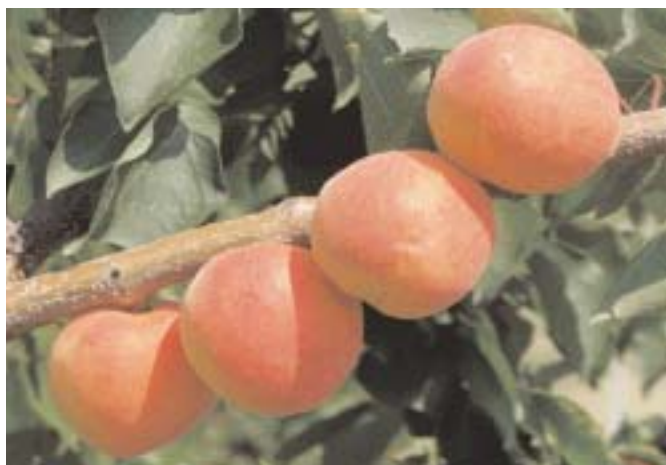
▲ Fig. 7 - Tardicot, cultivar a maturazione tardiva, in corso di valutazione. È molto simile a Tardif de Bordaneil, con cui ha in comune numerosi difetti.

Punti deboli: sapore e aspetto medio-scarsi.