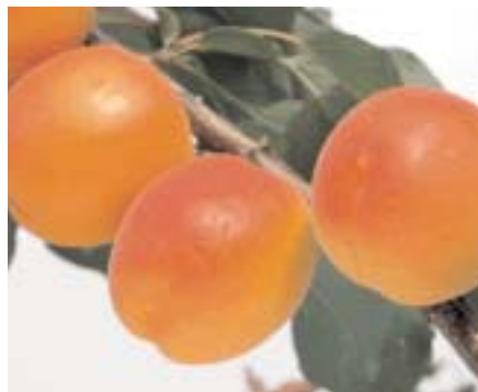
◀ Fig. 5 - Robada*, interessante nuova cultivar di origine californiana, parzialmente autoincompatibile

Punti forti: produttività, migliora le caratteristiche organolettiche nelle Isole.