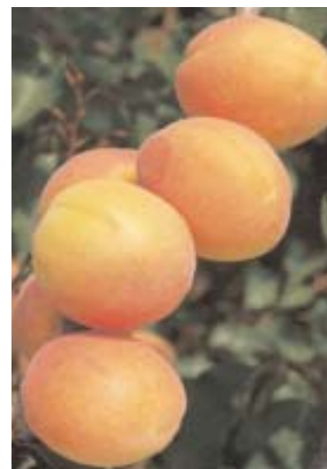
▲ Fig. 4 - Marietta* Milady®, nuova cultivar a maturazione tardiva, ancora in fase di valutazione; in alcune regioni ha confermato le sue caratteristiche organolettiche.

troppo soddisfacente al Centro. Le belle cultivar canadesi che maturano poco prima, o in epoca, di San Castrese, forniscono risultati molto diversi a seconda degli ambienti: Harcot va bene in Toscana; negli ambienti pedemontani di Piemonte e Veneto si sono diffuse Laycot ®* e Hargrand , dimostrando buona adattabilità e produttività; si sono dimostrate invece inaffidabili sotto l'aspetto produttivo nei più temperati sistemi collinari dell'Appennino romagnolo. Sono ancora in corso di valutazione Frenesie, Kar-