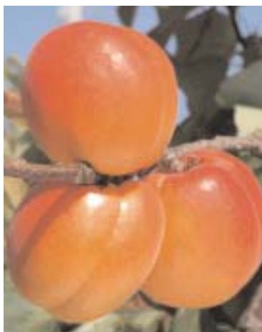
▲ Fig. 3 - Pinkcot® Cotpy*, cultivar americana di recente introduzione, autoincompatibile, quindi ancora da ben valutare per la produttività; interessante per molti caratteri commerciali.

troppo soddisfacente al Centro. Le belle cultivar canadesi che maturano poco prima, o in epoca, di San Castrese, forniscono risultati molto diversi a seconda degli ambienti: Harcot va bene in Toscana; negli ambienti pedemontani di Piemonte e Veneto si sono diffuse Laycot ®* e Hargrand , dimostrando buona adattabilità e produttività; si sono dimostrate invece inaffidabili sotto l'aspetto produttivo nei più temperati sistemi collinari dell'Appennino romagnolo. Sono ancora in corso di valutazione Frenesie, Kar-