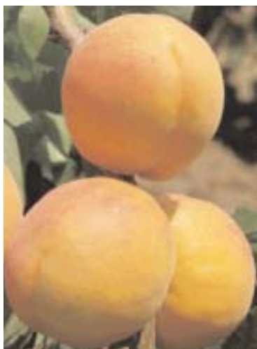
▲ Fig. 6 - Bergeron, vecchia cultivar che si è affermata in Francia nella valle del Rodano. In Italia, specialmente nel Centro-Sud, presenta produttività insoddisfacente o incostante per l'elevato fabbisogno in freddo.

Punti deboli: auto-incompatibile, non consigliata nell'Italia settentrionale.