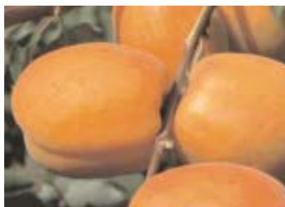
◀ Fig. 1 - Carmen Top® Carmen Pop*, cultivar di recente introduzione, ancora da ben valutare, interessante per epoca di maturazione, pezzatura, aspetto, sapore.

Nella stessa epoca di maturazione troviamo Perla e, a distanza di qualche giorno, Monaco Bello e Orange Red . Monaco Bello ,